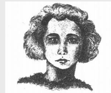
Retrato de Judith Teixeira, por Luis Gaspar

Em Portugal, até 1982, a homossexualidade foi crime punido com medidas de segurança que incluíam: o internamento em manicómio criminal; o internamento em casa de trabalho ou colónia agrícola; a liberdade vigiada; a caução de boa conduta; a interdição do exercício de profissão. O internamento fazia-se, entre outros locais, no Albergue da Mitra do Poço do Bispo, em Lisboa